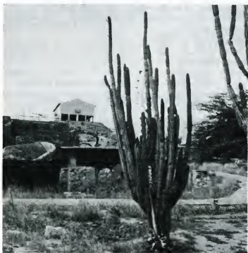
Pica pa e ruina